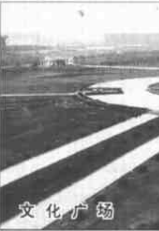
▼我市城市水系与环境工程现已建成12.6公里,完成绿地37万多平方米,水面面积达162万平方米,并将东城的清风湖、银湖、明月湖等公园连在了一起,形成了大空间、大水面、大绿地的城市园林绿化格局,为城市注入了生机和活力。