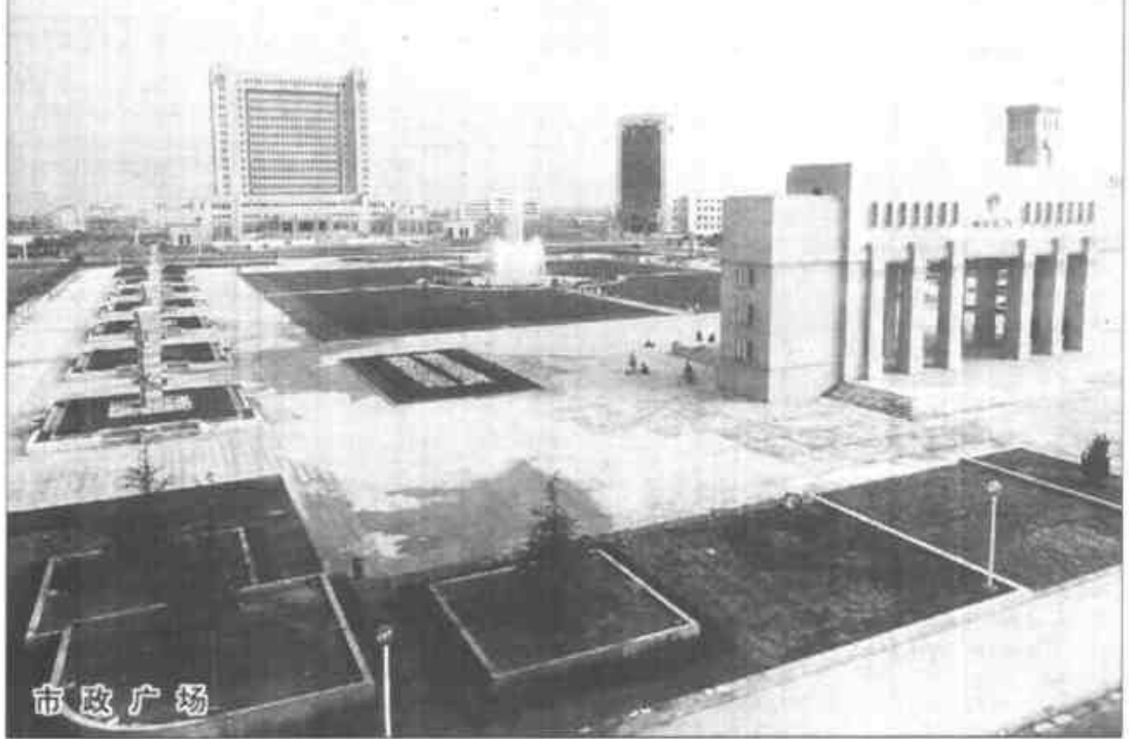
新落成的市政广场是我市标志性工程,总占地17万平方米,其中中心广场大型旱式音乐喷泉、组合灯柱与风格独特的新世纪门等建筑群相互映衬,气势恢宏庄严,成为油城的一大新景观。